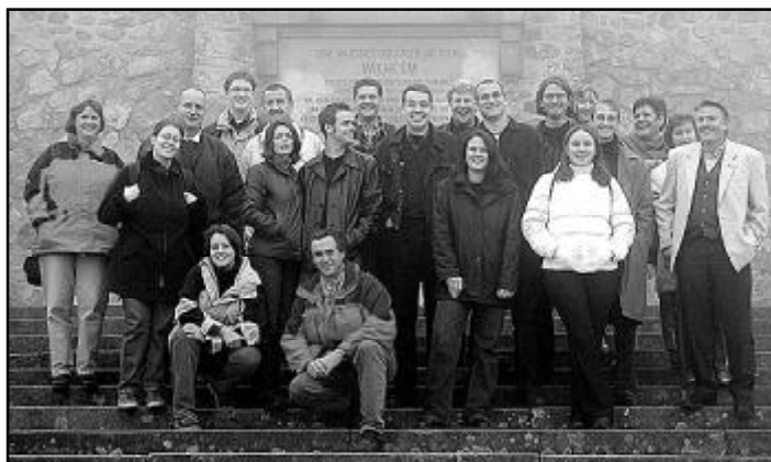
Trotz leichten Nebels war die gesamte Gruppe bester Laune, als sie sich zum ersten Foto am Niederwalddenkmal aufstellen mußte.

sikkabinett im altherwürdigen Brömserhof (15. Jhd. ). Der Rundgang durch die historischen, teilweise mit Fresken geschmückten Räume erwies sich unversehens als Augen- und Ohrenschaus. Ein veritabler Berber, versehen mit allen Merkmalen seines stolzen Stammes und voller Leidenschaft für deutsche Musikgeschichte, verstand es, mit Charme und einschmeichelnder Stimme vornehmlich unsere Damen in seinen Bann zu ziehen. Eine beispiellose Vielzahl unterschiedlichster automatischer Musikinstrumente, von der zarten Spieluhr bis zum riesigen Konzert-Piano-Orchestrion, faszinierte uns mit ihrer Klangfülle und -reinheit. Es war ein außergewöhnliches Erlebnis zu erfahren, wo diese Instrumente gebraucht wurden, welche Rolle sie früher im Leben der Menschen gespielt hatten, wer sie gebaut hatte und wie kompliziert sie funktionierten. Rein mechanische Appara-