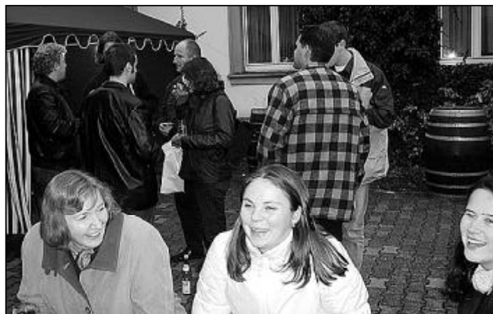
Assmannshäuser Höllenberg schmeckt am besten direkt vom Erzeuger, wie man an den Gesichtern unschwer erkennen kann.

Es blieb noch genügend Zeit für eine Fußerkundung des malerischen Weinstädtchens, berühmt für seine Rotweinlagen am Höllenberg. Mindestens genau so schön wie Rüdesheim, aber wesentlich ruhiger und beschaulicher. Am Rheinanleger bestiegen wir ein Motorschiff der Rössler-Linie. Kühn warf es sich in den Strom und bezwang mit seiner 400-PS-Maschine die gurgelnde Strömung im Binger Loch, einst Schrecken aller Schiffsleute. Wir saßen im Vorschiff knapp über der Wasserlinie und ließen uns hinter den Panoramascheiben Kaffee und Kuchen guttun. Nie habe ich einen duftigen Streuselkuchen so genossen. Auf der Höhe von Rüdesheim wendete das Schiff, und in rascher Fahrt ging es zurück nach Assmannshausen. In die einbrechende Dämmerung grüßen hoch vom linken Ufer die Lichter von Burg Rheinstein.